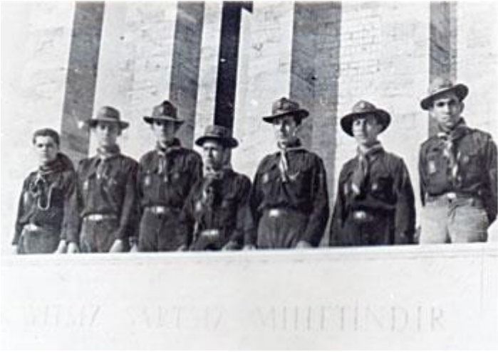
1959 Türkiye İzçileri, Yürüyüş Müsabakası birincisi Kartal Obası Anıt Kabirde