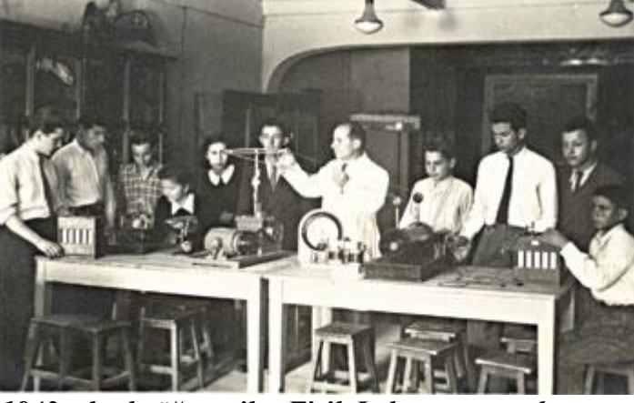
1943 yılında öğrenciler Fizik Laboratuvarında

1944 Yılında lisemiz mezunlarının İstanbulda kurduğu EDİRNE LİSESİNDEN YETİŞENLER CEMİYETİNİ'nin önerisi ile, her yıl pilav günü düzenlemesi kararlaştırılmış ve pilav günü olarak da 23 Nisan günü seçilmiştir. İlki 23 Nisan 1944 te yapılan ve geleneksel hale gelen PİLAV GÜNÜ'müz, altmış üç yıldan bu yana devam etmektedir. Her yıl Okulumuz İdaresi, Derneğimiz ve Vakfımızca ortaklaşa düzenlenen, pilav günümüz, camiamızı bir araya getiren, çok önemli etkinliklerden biridir.