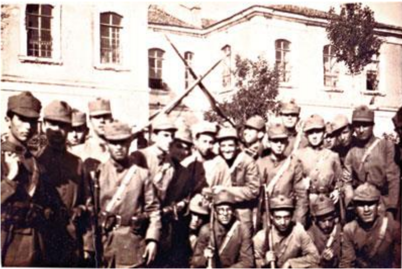
1938 yılı askerlik kampına katılan Edirne Lisesi öğrencileri

Güçlü bir öğretmen kadrosunun yanında, okulun fiziki imkanları da çok iyi durumdaydı. Türkiye'nin birçok ilinde spor salonu yokken, lisemizin özel spor salonu bulunmaktaydı. Zengin bir kütüphanesi, resim ve eliş atölyeleri, müzik dershanesi, tenis kortları, laboratuvarları ve özellikle 1930 lu yıllarda okul bahçesine müstakil olarak inşa edilen kimya laboratuvarı, 1960'lı yıllarda bile, birçok yüksek okulda, böyle bir kimya laboratuvarı yoktu. Yatılı öğrencilerin, yatakhaneleri, banyoları ve yemekhanelerinin de standartları, o günün koşullarına göre çok iyi idi.