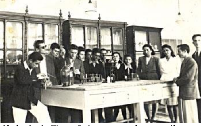
1943 yılında Kimya Laboratuvarında öğrenciler deney yaparken.

Gerekli tedbirler Milli Eğitim Müdürlüğünce alınmış olmalı ki, 1953-1954 ders yılında, biz ortaokul öğrencileri, ikili öğretim şeklinde, Ticaret Lisesi binasında ve yanındaki halk eğitim merkezinin bir kısım odalarında eğitim gördük. Lise sınıfları da Kaleiçindeki, bugünkü Şehit Asım İlkokulunda eğitimlerine devam ettiler. Okulumuzun yatılı kısmı kapatıldı, parasız yatılı olan öğrenciler, İstanbul Haydarpaşa Lisesine nakledildiler. Okulumuzun iki binasında da onarım işlemlerine hemen başlandı. O zaman ders yılı üç kanaat dönemine ayrılırdı, dolayısıyla da üç karne alırdık. Lise binasının onarımı süratle tamamlanınca, birinci karne tatilinden sonra, (25 Ocak 1954 Pazartesi günü) ikinci kanaat dönemini lise binasında okuduk. Lise sınıfları üst katlarda, Ortaokul sınıfları bodrum katta. Yukarıdaki eski lise binasının onarımı hayli uzun sürdü. Bu bina ancak, 1955 – 1956 ders yılının, üçüncü kanaat döneminde, yeniden kullanıma açılabilirdi.